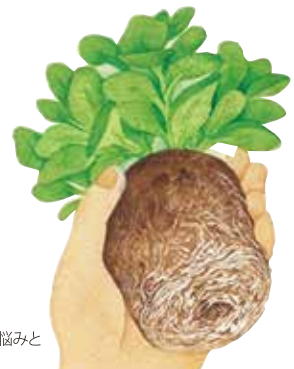
引用：サカタのタネ園芸通信 初心者さんもやってみよう！ タネまきから苗育てAtoZ 【第18回】 苗が育たない悩みと老化について