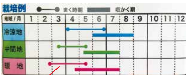
種を蒔く時期の目安