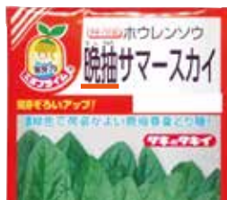
↑ホウレンソウ「晩抽サマースカイ」(タキイ種苗)