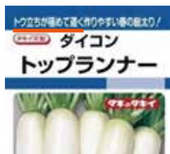
↑ダイコン「トップランナー」(タキイ種苗)