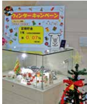
審査員特別賞 能勢支店