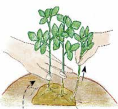
種いもを引き上げないように株元を押さえ、斜めの方向にかきとりましょう!

芽が10cmほど伸びたら、芽かきをします。丈夫な芽を2本残し、他の芽は除きましょう。