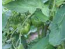
ベネチアンサンセット

中玉トマトでゼブラ模様が特徴です。(6月中旬の栽培中のトマトです。栽培中ですが、ゼブラ模様が見えます!)