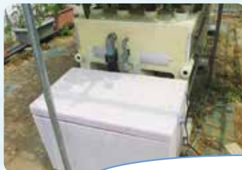
このタンクで水と肥料を循環しています。