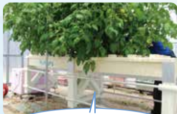
水耕栽培の為、下が空洞だ~。