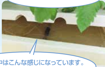
水槽の中はこんな感じになっています。トマトの根がたくさん生えていますね。