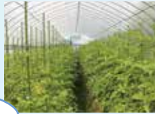
ハウス内のトマト