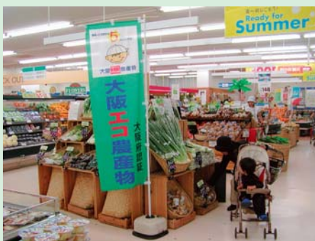
大阪エコ農産物の販売風景