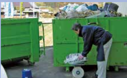
ビニール等を回収している様子

廃棄するマルチ、ビニール等(農業用廃プラスチック類)は産業廃棄物処理法にもとづき適切な処理が必要となります。当JAでは毎年2月に農業用廃プラスチック類の回収・処理を実施しておりますのでご利用ください(有料)。