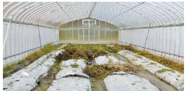
根を引き抜いて乾燥させている状態

夏野菜は草丈の高い野菜が多く片付けるのも一苦労です。片付ける前に根を引き抜いて畑で数日間乾燥させます。こうすることでかさが減り後の作業がぐっと楽になります。引き抜いた株は病害虫の発生源になることがありますので、そのままにしておかず畑の外に持ち出して処分しましょう。